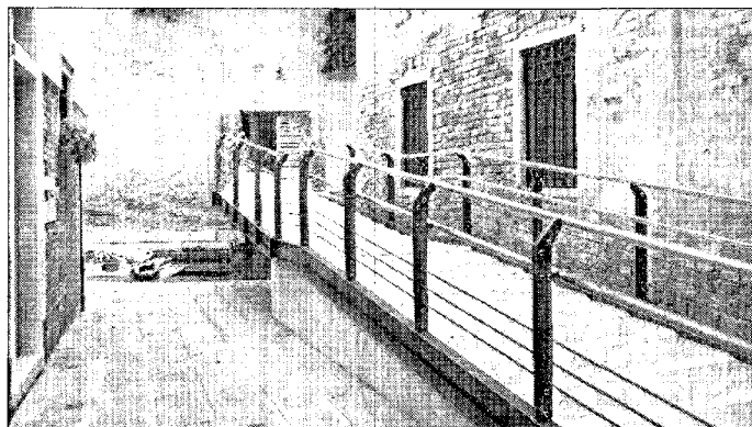
Il nuovo Ponte all'Arsenale messo sotto accusa dai residenti

In Municipalità Costalonga (Pdl) chiede lumi: «Nessuno è stato informato e mancano agli atti i pareri di Soprintendenza e Salvaguardia»